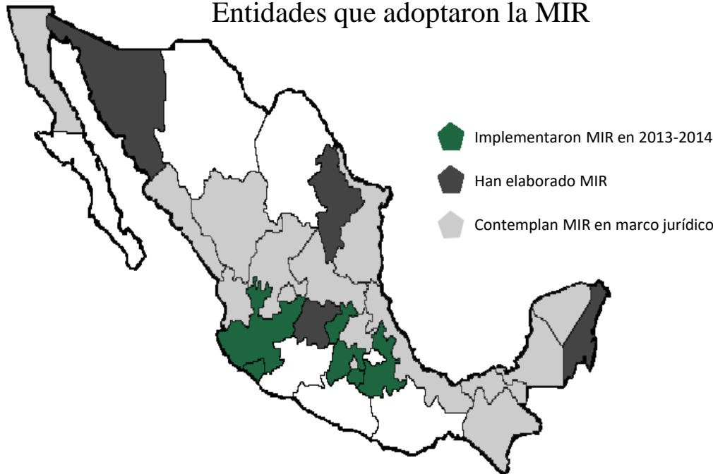
Entidades que adoptaron la MIR

Aunque 27 entidades federativas contemplan la implementación de la MIR en su marco jurídico, el reto para el Gobierno Federal es que este instrumento regulatorio se convierta en una disciplina de análisis de la regulación previa a su emisión.